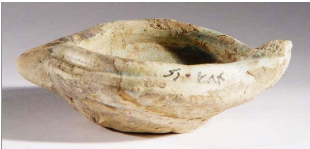
تصویر ۲. پیه سوز سفالی لعاب دار، شوش، دوره ساسانی؛ درازا: ۱۰ سانتی متر (موزه ملی ایران، ش. ۶۸۴).

۳. پیه سوزهای کاملاً گرد با بدنه باز: این طرح اولین تحول جدی در راستای تفکیک کامل مخزن و فتیله گیر پیه سوزها محسوب می شود. فرم کلی آن عبارتست از پیاله کم عمقی که اندکی از لبه آن به داخل ظرف برگشته و فرم مدور و کوچک دیگری نیز از جلو به آن چسبیده است. بخش کوچک اضافه شده در حقیقت نقش فتیله گیر چراغ را برعهده دارد که به صورت جداگانه ای طراحی شده است. پیش از این هرگز نمی توان فتیله گیر جداگانه و متمایزی را در چراغ های سفالی مشاهده کرد. چه بسا طراحی این فرم ها از تأثیرات یونانی بوده باشد که در تولید چراغ های ایرانی آن دوره راه یافته است. این تأثیرپذیری از آن رو پیش کشیده می شود که در دوره های بعدی و حتی در دوره