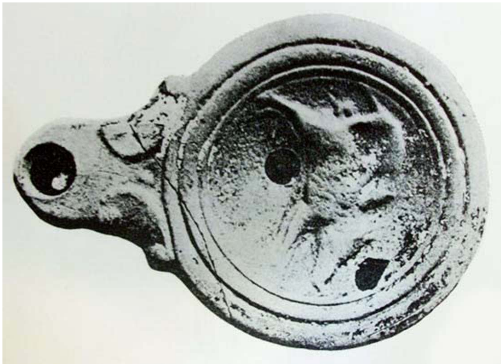
تصویر ۶. پیه‌سوز سغالی با بدنه بسته و نقوش قالب‌گیری شده، دوره اشکانی یا ساسانی، موزه لنینگراد (Pope, 1977: pl.145C).