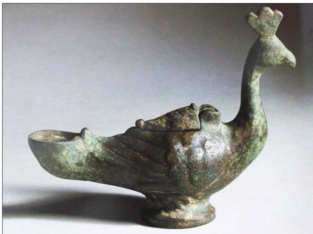
تصویر ۱۰. چراغ-طاووس مفرغی از کرمانشاه، سده اول قبل از میلاد تا سده سوم میلادی ریخته‌گری در دو قالب با روش موم‌زایی، درازا: ۱۶٫۶ سانتی‌متر، بلندا: ۱۴٫۲ سانتی‌متر (Mahboubian, 1997: no.342).

به نظر می‌رسد برای اولین بار در چراغ‌های جانورسان با ظهور درپوشی برای مخزن مواجه شده‌ایم. هرچند از تاریخ دقیق ساخته شدن این چراغ آگاهی کاملی در دست نیست و دامنه حدس‌ها از سده اول قبل از میلاد تا سده سوم میلادی گسترده است. ۲ با وجود این از آنجاکه ترکیب یک اشکال جانورسان با ظروف کاربرد فراوانی در دوره اشکانی داشته است (پرادا، ۱۳۵۷: ۲۷۶) و با توجه به تاریخ تقریبی که متخصصان ارائه کرده‌اند، به نظر می‌رسد بتوان تولید این چراغ-طاووس را به دوره اشکانی نسبت داد.