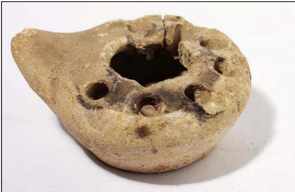
تصویر ۴. پیه سوز سفالی بدون لعاب، شوش، دوره سلوکی (موزه ملی ایران، ش. ۱۲۶۲).

چراغ‌های سفالی مواجهیم. فتیله‌گیر این چراغ‌ها به شکل نایژه خمیده درازی، از بدنه آن‌ها فاصله گرفته است. این ویژگی در پیه سوزهای مفرغی دیرینگی بیشتری از انواع سفالین آن‌ها دارد و به ویژه از آنجاکه در این دوره سلیقه هنری زمانه نیز از آثار و وسیله‌های مفرغی الگو می‌گرفته است (ر.ک. به: گیرشمن، ۱۳۴۴: ۲۷۵). به نظر می‌رسد سفال‌گران نیز کلیات این طرح را از نمونه‌های فلزی اقتباس کرده‌اند؛ زیرا اجرای این شکل خاص بیشتر مناسب ریخته‌گری فلز است تا سفال‌گری. بدنه کاملاً کروی، فتیله‌گیر نایژه‌ای بسیار دراز، لبه عمودی روی دهانه مخزن و پایه کوچکی که زیر بدنه قرار گرفته است، از عمده ویژگی‌های انتقال یافته به وسیله‌های دوره‌های بعدی به شمار می‌رود. از دیگر ویژگی‌های بارز این پیه سوزها می‌توان به استفاده از دسته‌های حلقه‌ای، به جای دسته‌های باریک و افقی نمونه‌های پیشین اشاره کرد (تصویر ۵).