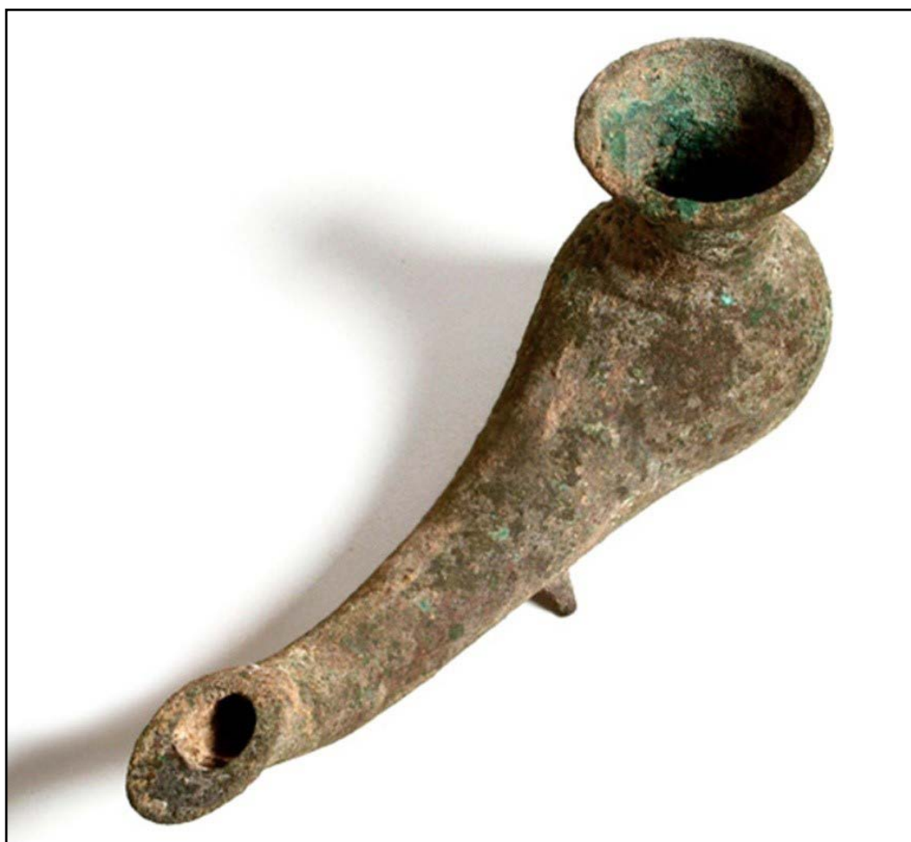
تصویر ۷. پیه‌سوز سفالی بدون لعاب، شوش، دوره سلوکی (موزه ملی ایران، ش. ۱۱۲۰).

۱. پیه‌سوزهایی با فتیله‌گیر نایژه‌ای کشیده: اساسی‌ترین ویژگی این پیه‌سوزها، فرم کشیده فتیله‌گیر آن‌هاست در هماهنگی کامل با شکل مخزنشان. فرم کلی این چراغ‌ها به استوانه خمیده پاشنه‌داری می‌ماند؛ هرچند پیش از این زمان در ایران نمونه مشابهی را نمی‌یابیم، جست‌وجوی چراغ‌های فلزی تمدن‌های همسایه نشانی چراغی بین‌النهرینی را در هزاره اول قبل از میلاد به دست می‌دهد (Nakayama, 2004a). این چراغ نقره‌ای نیز لوله پاشنه‌داری را می‌ماند که گلوپی برای ریختن روغن در آن ایجاد شده است. وجود این فرم از پیه‌سوزهای فلزی دلیلی بر رواج آن‌ها در دوره‌های بسیار دورتر در این منطقه است. بعدها مشاهده می‌شود که شکل بنیادین این چراغ‌ها به طور گسترده در دوره اسلامی پی گرفته می‌شود (برای مثال ر. ک. به: Melikian-Chirvani, 1973, Fig. 14 و Melikian-chirvani, 1982, No.35). نمونه جالب توجهی از این دست چراغ‌ها از دوره هخامنشی به دست آمده است (تصویر ۷).