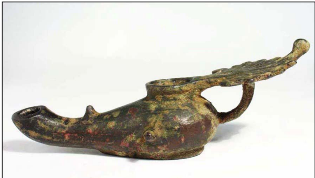
تصویر ۸. پیه‌سوز مفرغی با فتیله‌گیر بلند، دوره سلوکی (موزه ملی ایران، ش. ۱۳۴۴).

چراغ‌های مفرغی دوره‌های بعدی نیز تقریباً در ادامه فرم همان چراغ هخامنشی هستند، با این تفاوت که در اینجا شکل‌ها پخته‌تر شده و ظرافت و دقت طراحی بسیار بیشتر از نمونه‌های قبلی است؛ همچنین برخلاف چراغ هخامنشی، در این دوره شاهد افزوده شدن دسته بزرگی به پشت بدنه پیه‌سوزها هستیم. اغلب این دسته‌ها را جاشستی‌های برگ‌شکل بسیار بزرگی پوشانده است. مخزن چراغ شکل تخم‌مرغ‌مانندی دارد که به منظور افزایش ایستایی ظرف در پایین مسطح شده است. درکنار این‌ها، نمونه‌های دیگری نیز وجود دارد که پایه‌های جداگانه‌ای برای آن‌ها در نظر گرفته شده است (تصویر ۸).