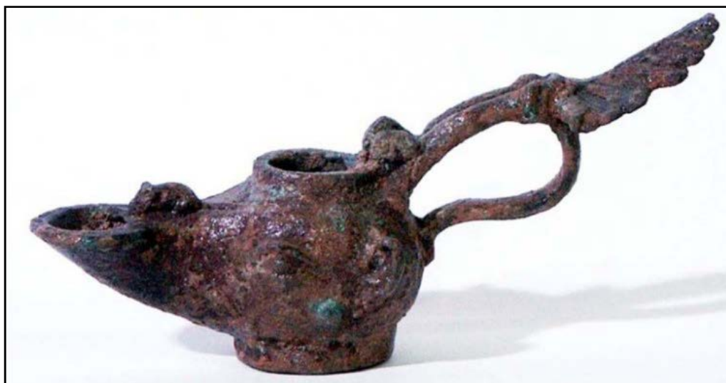
تصویر ۹. پیه‌سوز مفرغی از سرمسجد، دوره اشکانی؛ نقش برجسته یک موش در حال بوکشیدن از دهانه فتیله‌گیر بر روی آن ایجاد شده است (موزه ملی ایران، ش. ۴۱۳۳).

به نظر می‌رسد برای اولین بار در چراغ‌های جانورسان با ظهور درپوشی برای مخزن مواجه شده‌ایم. هرچند از تاریخ دقیق ساخته شدن این چراغ آگاهی کاملی در دست نیست و دامنه حدس‌ها از سده اول قبل از میلاد تا سده سوم میلادی گسترده است. ۲ با وجود این از آنجاکه ترکیب یک اشکال جانورسان با ظروف کاربرد فراوانی در دوره اشکانی داشته است (پرادا، ۱۳۵۷: ۲۷۶) و با توجه به تاریخ تقریبی که متخصصان ارائه کرده‌اند، به نظر می‌رسد بتوان تولید این چراغ-طاووس را به دوره اشکانی نسبت داد.