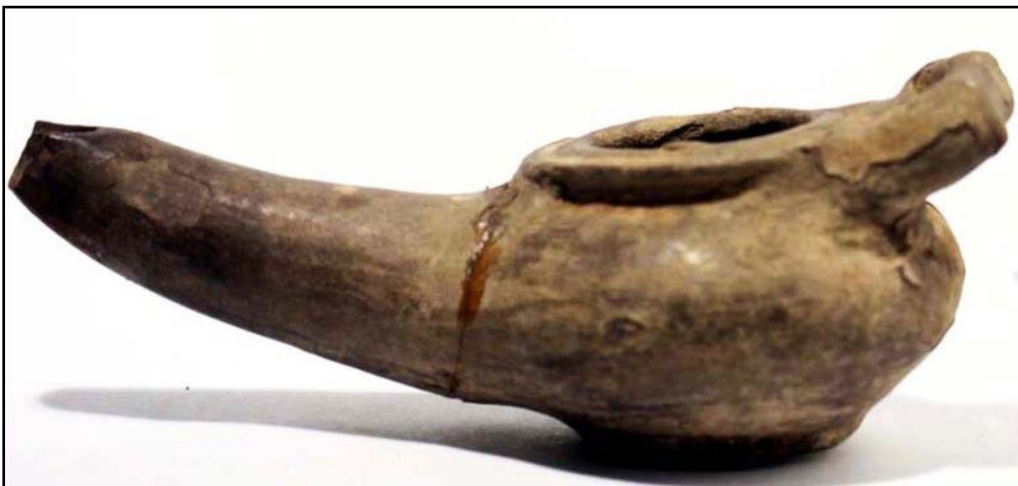
تصویر ۵. پیه سوز سفالی بدون لعاب، شوش، دوره سلوکی (موزه ملی ایران، ش. ۱۱۲۰).

چراغ‌های سفالی مواجهیم. فتیله‌گیر این چراغ‌ها به شکل نایژه خمیده درازی، از بدنه آن‌ها فاصله گرفته است. این ویژگی در پیه سوزهای مفرغی دیرینگی بیشتری از انواع سفالین آن‌ها دارد و به ویژه از آنجاکه در این دوره سلیقه هنری زمانه نیز از آثار و وسیله‌های مفرغی الگو می‌گرفته است (ر.ک. به: گیرشمن، ۱۳۴۴: ۲۷۵). به نظر می‌رسد سفال‌گران نیز کلیات این طرح را از نمونه‌های فلزی اقتباس کرده‌اند؛ زیرا اجرای این شکل خاص بیشتر مناسب ریخته‌گری فلز است تا سفال‌گری. بدنه کاملاً کروی، فتیله‌گیر نایژه‌ای بسیار دراز، لبه عمودی روی دهانه مخزن و پایه کوچکی که زیر بدنه قرار گرفته است، از عمده ویژگی‌های انتقال یافته به وسیله‌های دوره‌های بعدی به شمار می‌رود. از دیگر ویژگی‌های بارز این پیه سوزها می‌توان به استفاده از دسته‌های حلقه‌ای، به جای دسته‌های باریک و افقی نمونه‌های پیشین اشاره کرد (تصویر ۵).