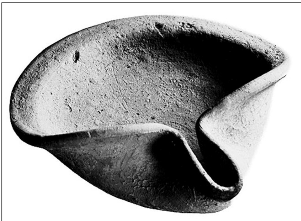
تصویر ۱. پیه سوزهای سفالی، دوره هخامنشیان، ۵۸۷ تا ۳۳۳ ق.م. بلندا: ۴٫۵ سانتی متر، پهنا: ۱۳٫۵ سانتی متر. (Oil Lamp, 2007).